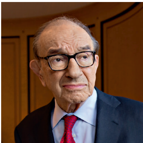
Hysterische Feindschaft: Ex-Fed-Chef Greenspan.

Bei der Kommissionsberatung habe er die Frage gestellt, sagt Ulrich Schlüer (SVP) im April 1998 im Nationalrat, «weshalb im Entwurf zur neuen Verfassung der Hinweis auf das Gold, den wir in der alten Verfassung haben,