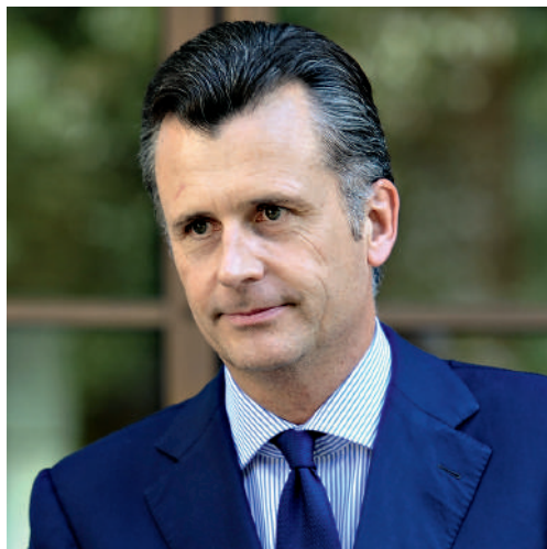
Glück und Geschick: Ex-SNB-Chef Hildebrand.